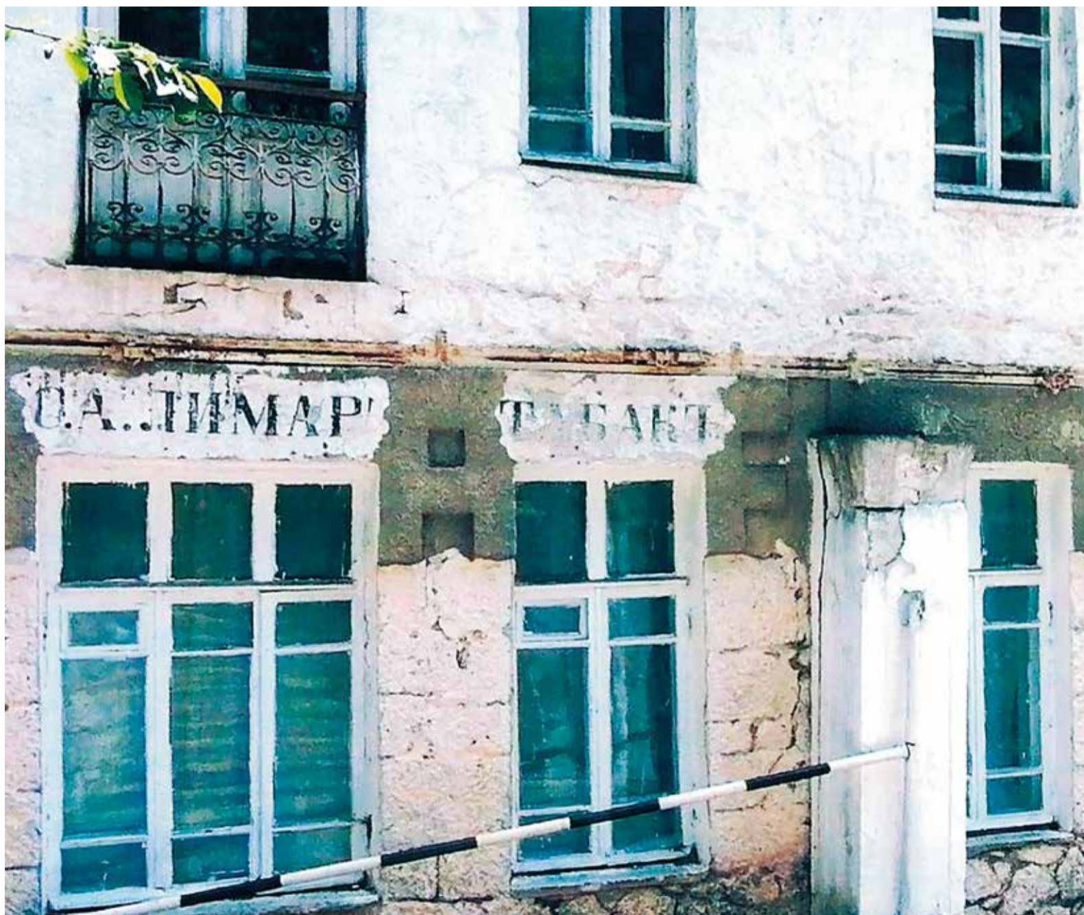
Старая Ялта. Фото Марины Медведевой