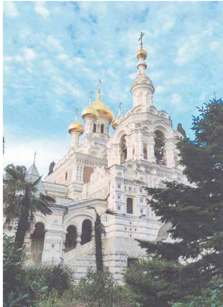
Собор Александра Невского.