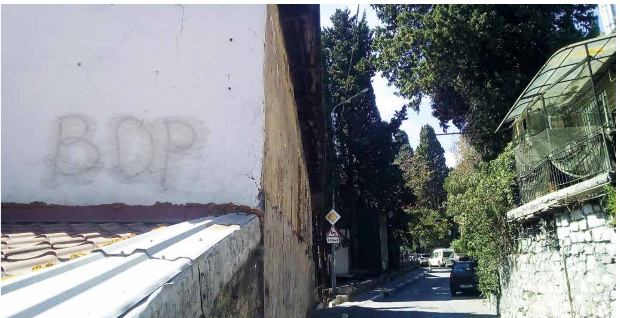
Сколько в обществе агрессии! По улице Кирова ежедневно проезжают сотни машин и все водители видят обидную надпись на одном из домов. Стыдно за её автора!