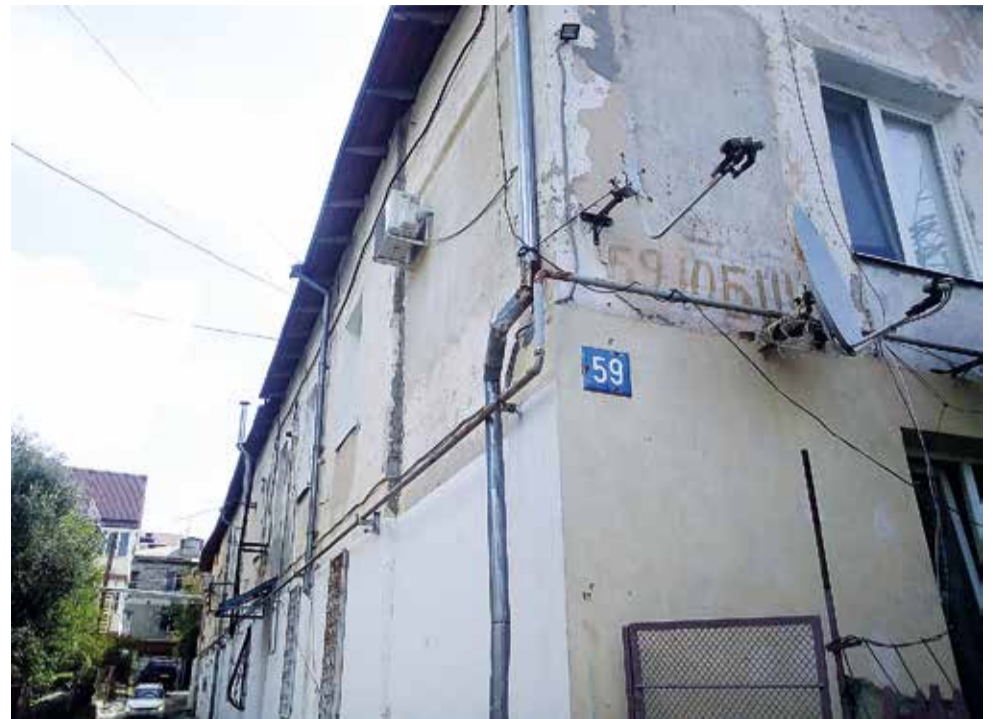
Южнобережное шоссе, дом 59. Люди жалуются на плохую работу маршрутки 25. А ещё здесь нужно установить информационный стенд, чтобы прочитать объявления и узнать график приёма граждан в горсовете и администрации.