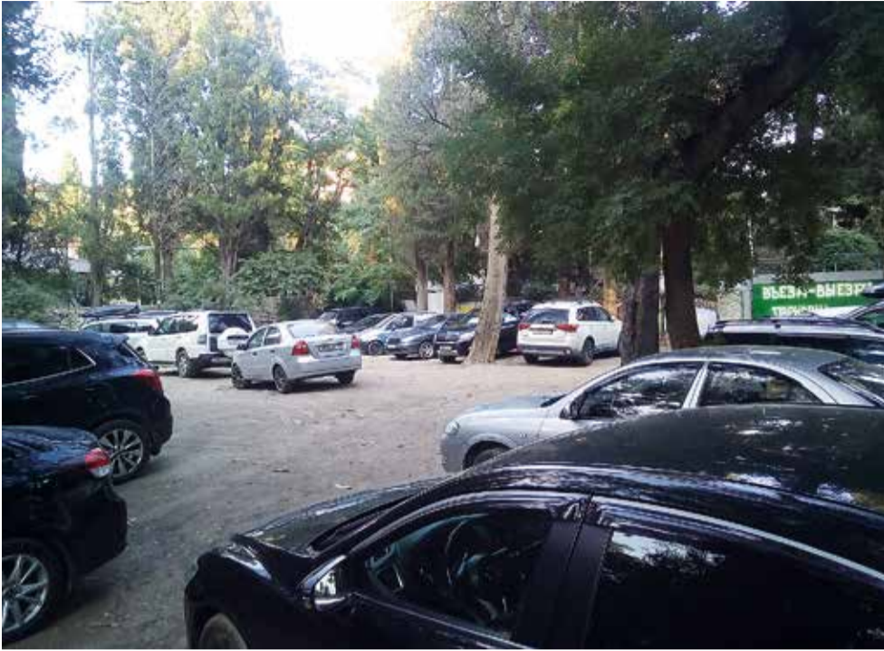
В проходе между улицами Кирова и Чехова (рядом с городской прокуратурой) очень замусорено и грязно, а на месте бывшей детской площадки устроена импровизированная автостоянка. Парковки нужны, но официальные!