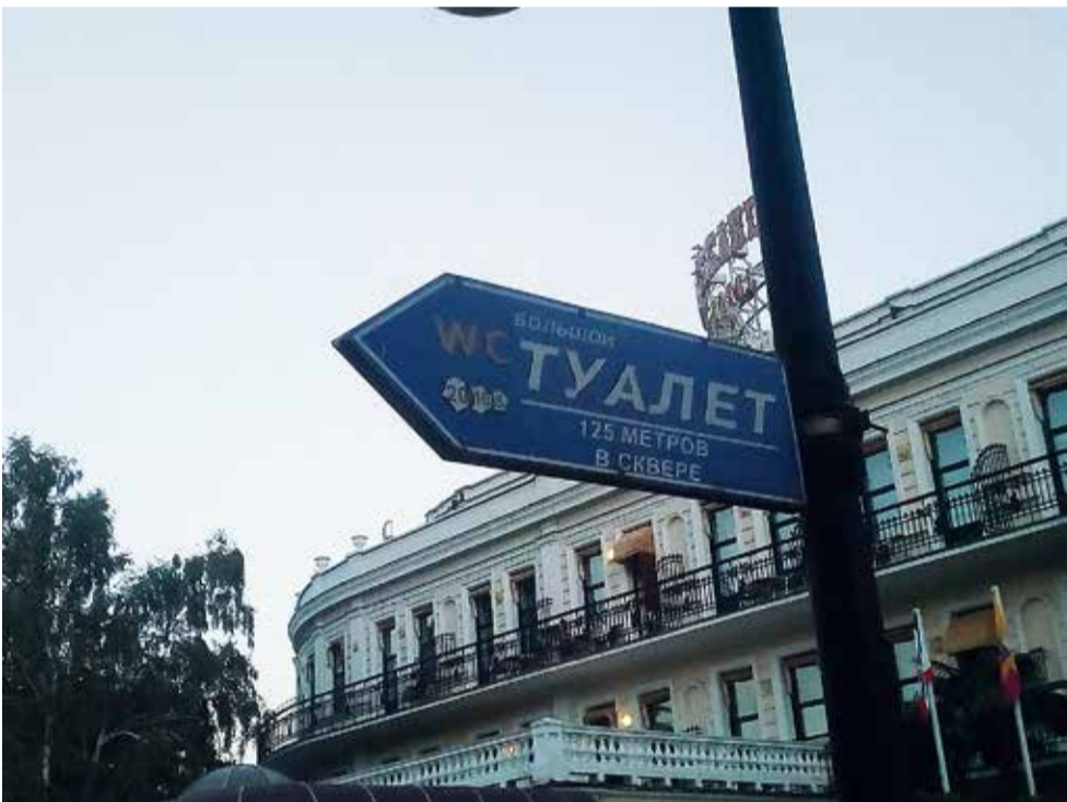
Как-то на аппаратном совещании в горадминистрации я сказал; «В Москве есть Большой театр, а в Ялте есть большой туалет». Все рассмеялись, но пока указатель на улице Гоголя у гостиницы «Ореанда» не изменился.