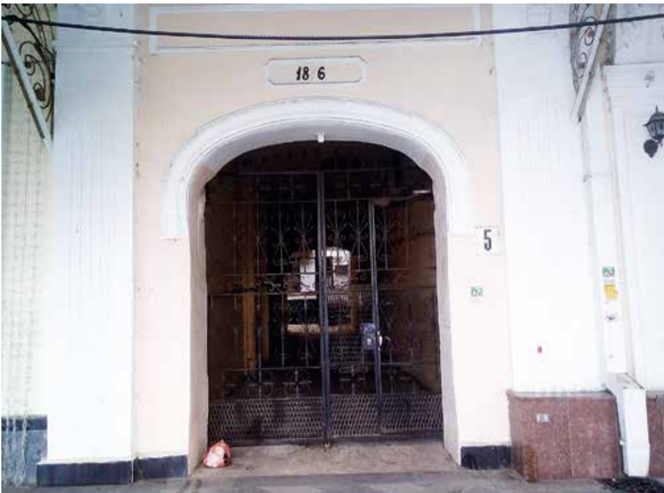
Набережная им.В.И.Ленина, дом 5. После реконструкции главной улицы курорта Брайко с Кириченко ревностно следили, чтобы всё было безукоризненно. А сейчас отвалилась цифра года постройки дома — и никому нет дела.