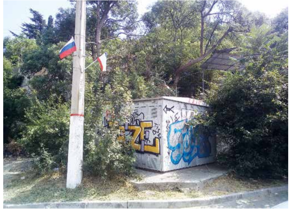
Рядом с детской поликлиникой на улице Красноармейской «разукрашена» трансформаторная будка. Видимо, коммунальщикам надо уметь не только флажки развешивать, но и приводить в порядок окружающую территорию.