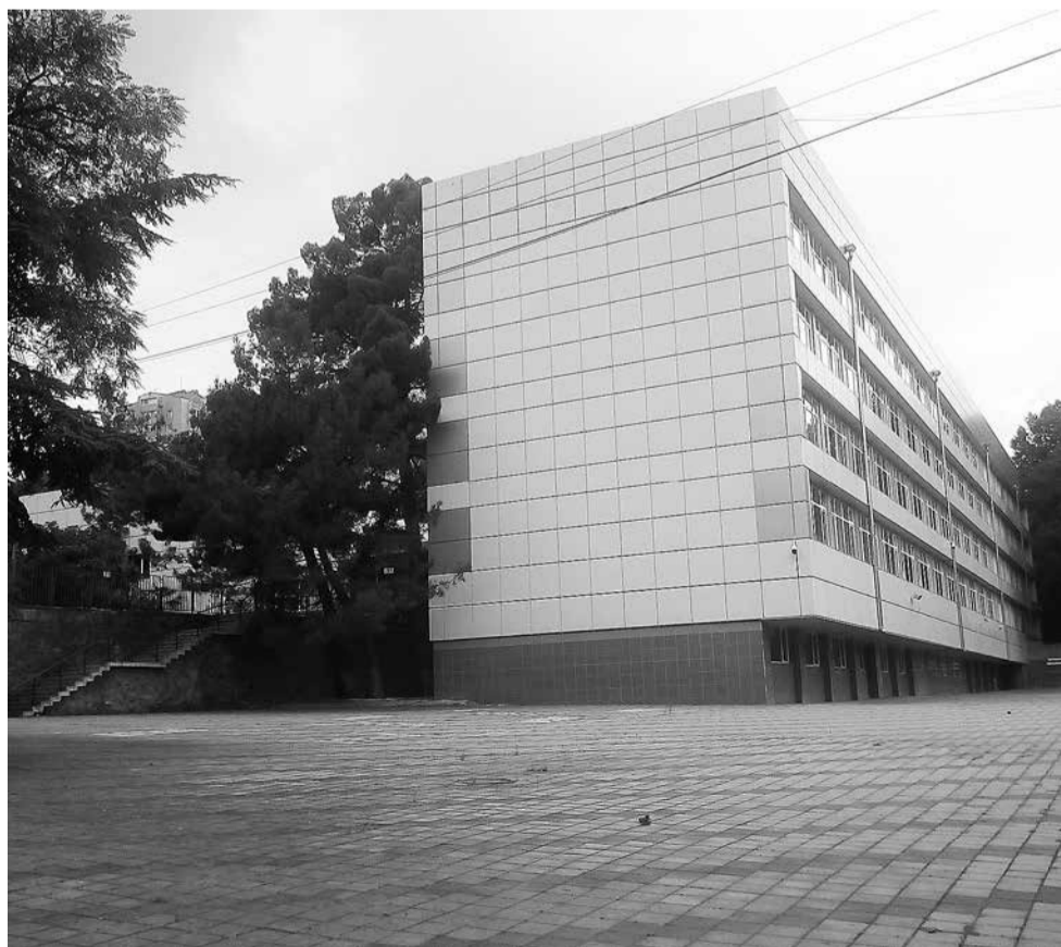
Как было бы здорово одухотворить торец здания школы №2 на улице Красноармейской! Уйти от казённости и нарисовать здесь радостную, оптимистичную картинку или лозунг!

Интересно, что когда куда-нибудь уезжаешь и говоришь, что ты из Ялты, то люди сразу улыбаются.