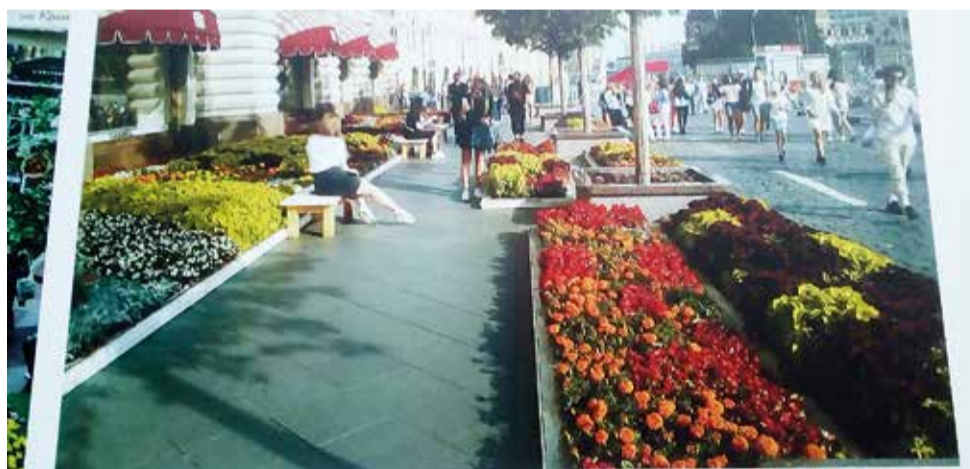
ГУМ НА КРАСНОЙ ПЛОЩАДИ.