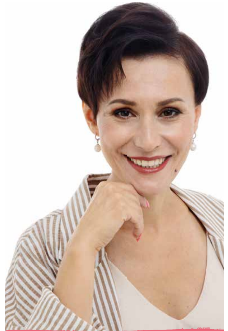
Симферопольский одномандатный избирательный округ №19

А будущее за молодыми! И я всегда борюсь и надеюсь — победа будет за нами!