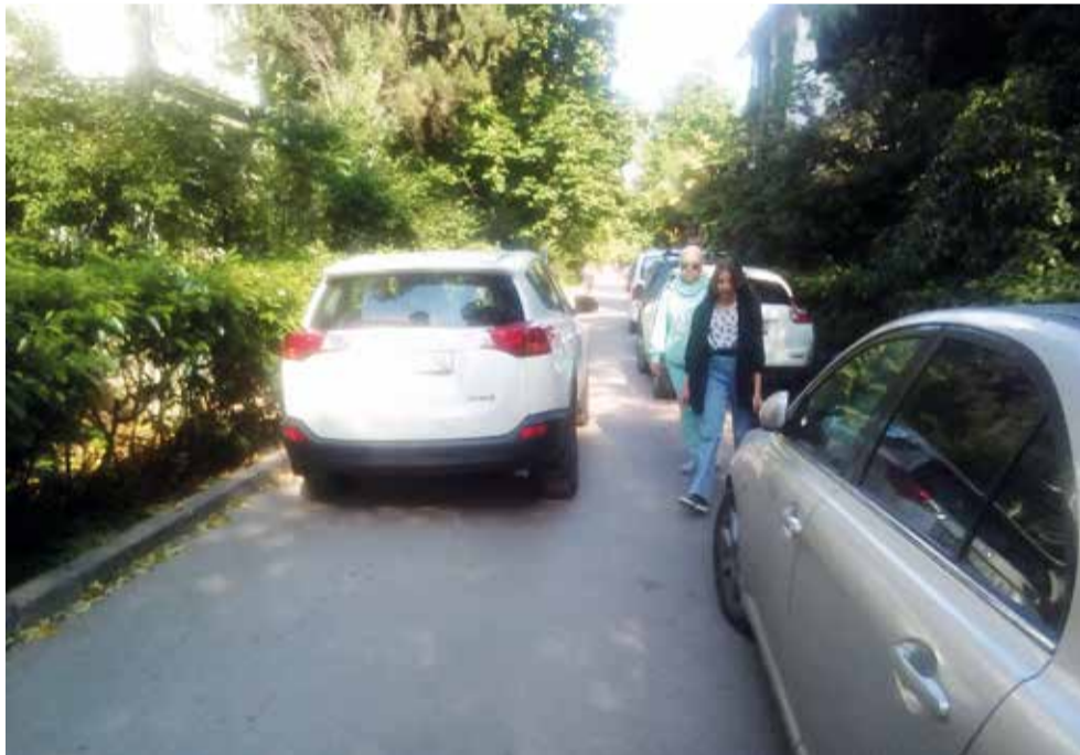
На участке от поликлиники до Боткинской просто нет тротуаров. Пешеходом зачастую приходится уворачиваться от автомобилей.