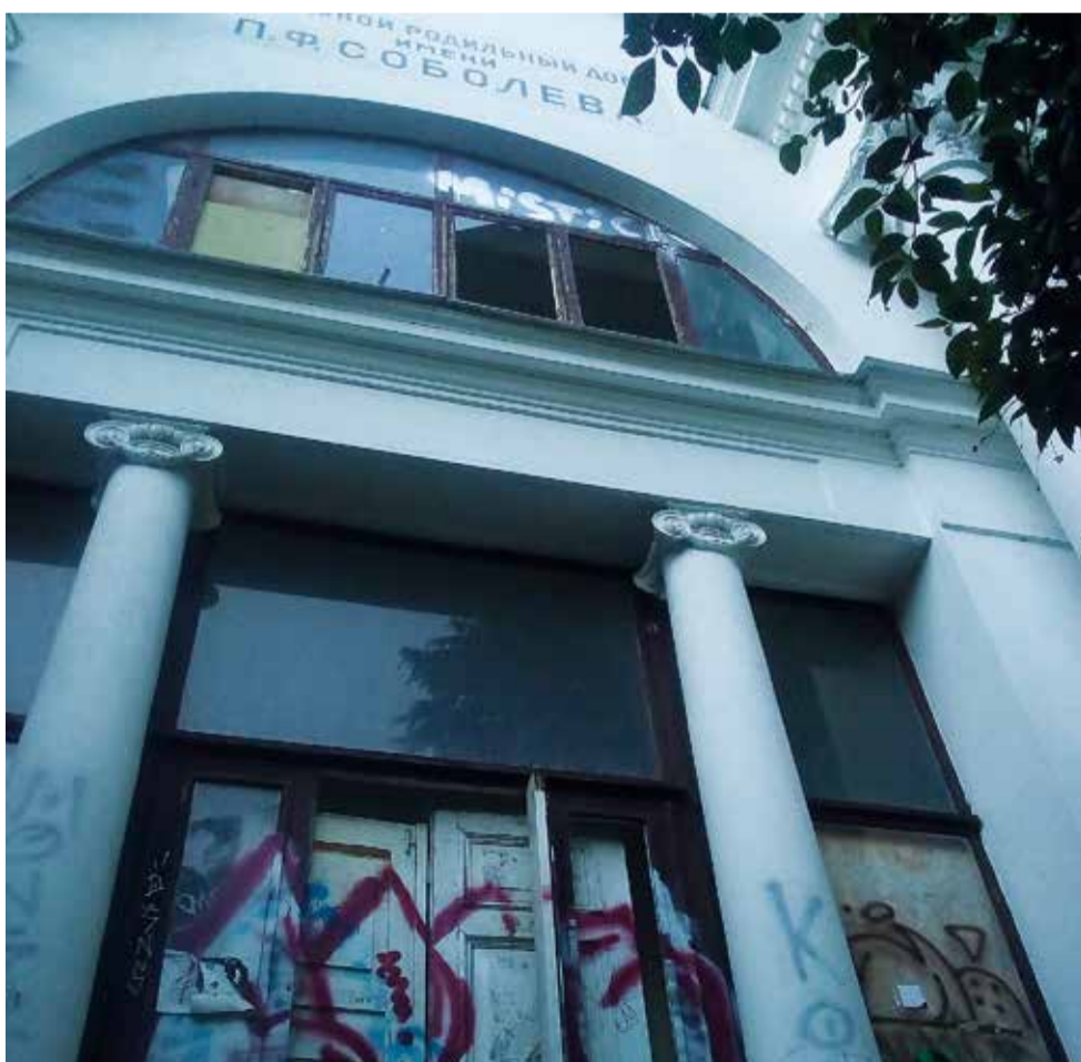
Улица Ломоносова. Роддом имени Соболева находится в ужасающем состоянии. А ведь это памятник культурного наследия и государство должно заботиться о таких дореволюционных зданиях.