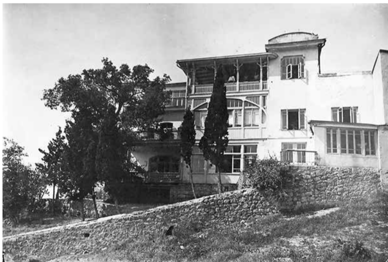
Восточный фасад дома Н.П.Краснова. 1930-е гг

P.S. Если вы сможете найти небольшие фрагменты дома Краснова для каждого из нас... само собой разумеется, как это много будет значить для нас... хотя известие о потере в Ялте разбивает сердце.