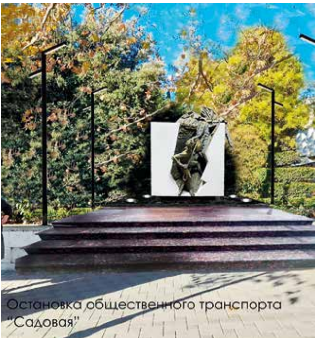
Остановка общественного транспорта "Садовая"

И сам принцип композиции очень современный и оригинальный, позволяющий зрителю взаимодействовать с произведением.