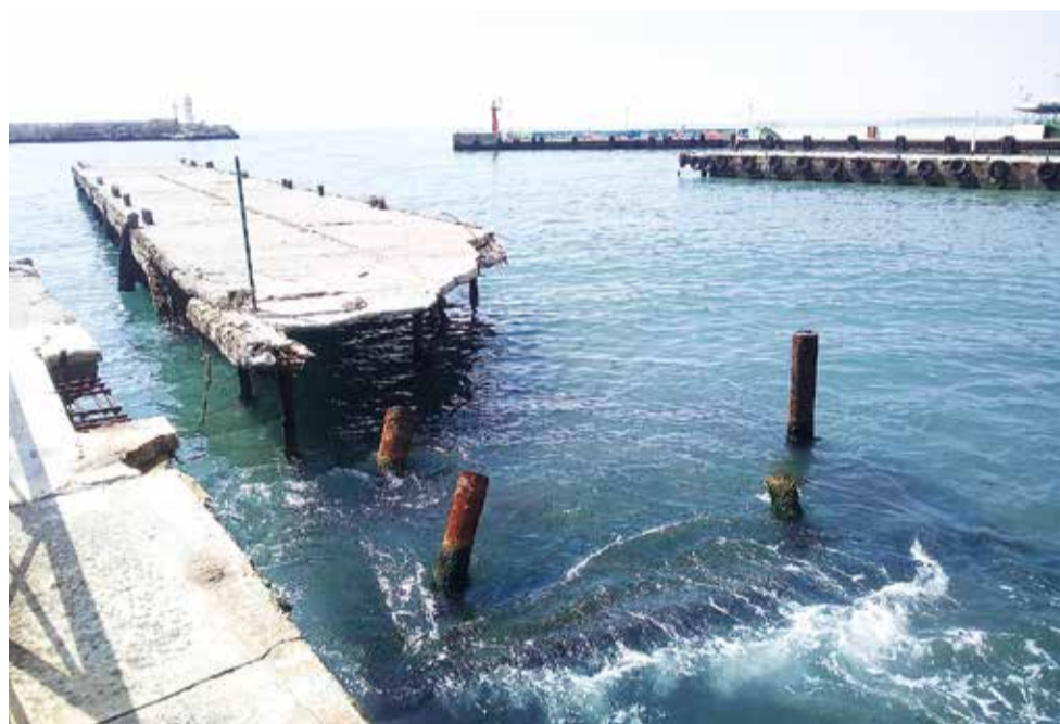
Набережная им. В.И. Ленина. Уже 8 (восемь!) лет морпорт не может демонтировать аварийный причал. Нет денег! Хотя 23 марта на совещании в Ялте Глава Крыма Сергей Аксёнов подобные ситуации предлагал решать хозспособом. Действительно, перфоратором бы отбить бетон, да опоры срезать.