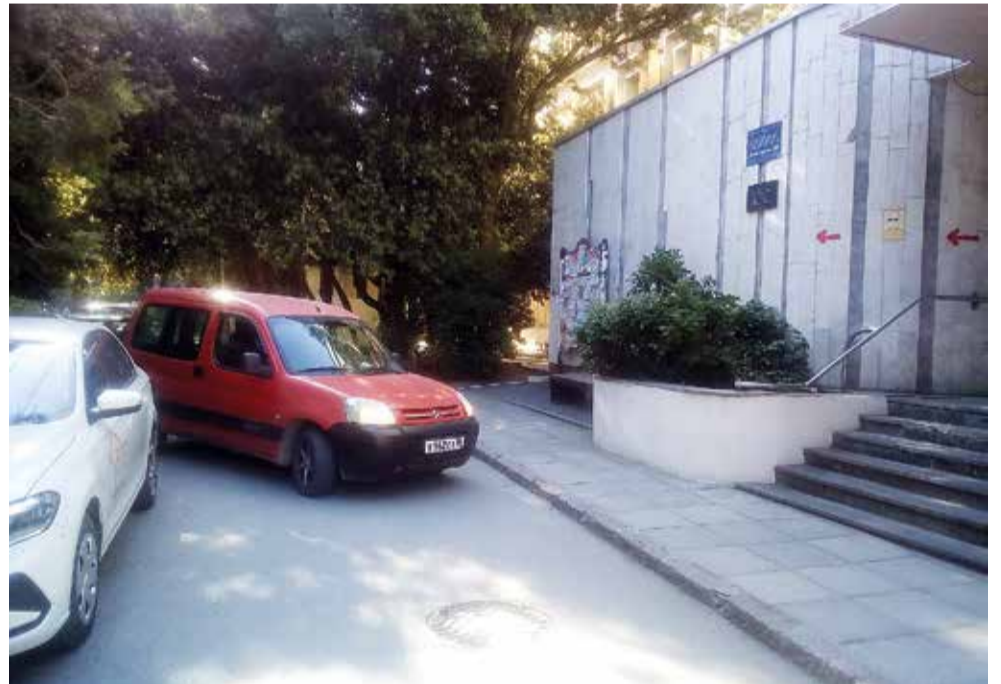
А если надо высадить пассажира у главного входа в горполиклинику, то парализуется всё дорожное движение на улице Пальмиро Тольятти.