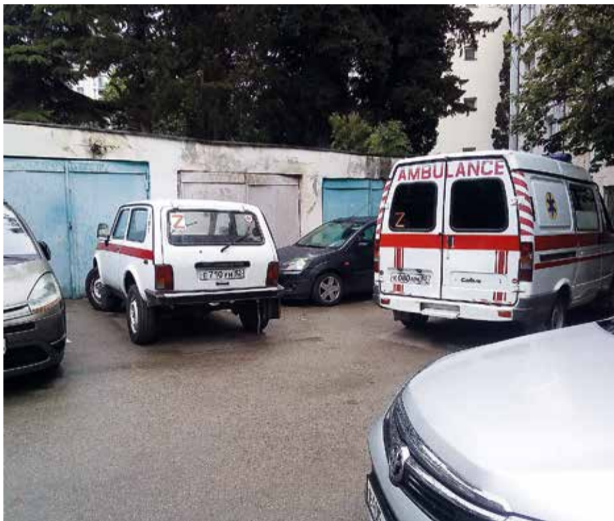
Много бывает машин во внутреннем дворе поликлиники! Иногда даже «Скорая помощь» с трудом здесь разворачивается.

— Многие ялтинцы обеспокоены тем, что очень часто как машины «Скорой помощи», так и другие автомобили не могут подъехать к городскому травмпункту и к самой горполиклинике. Также горожан возмущает затруднённое движение пациентов-пешеходов в районе горполиклиники. Плюс к этому начинается курортный сезон, горполиклиника находится в центре города... Какие действия предпринимались и предпринимаете?