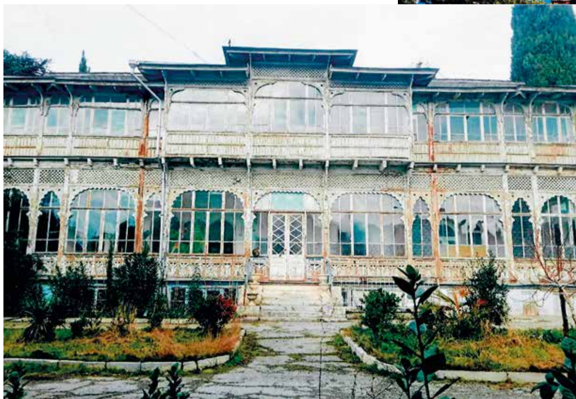
Дача Меллер-Закомельских.

Гордимся Ялтой и её юными гражданами, любящими и ценящими наследие нашего города!