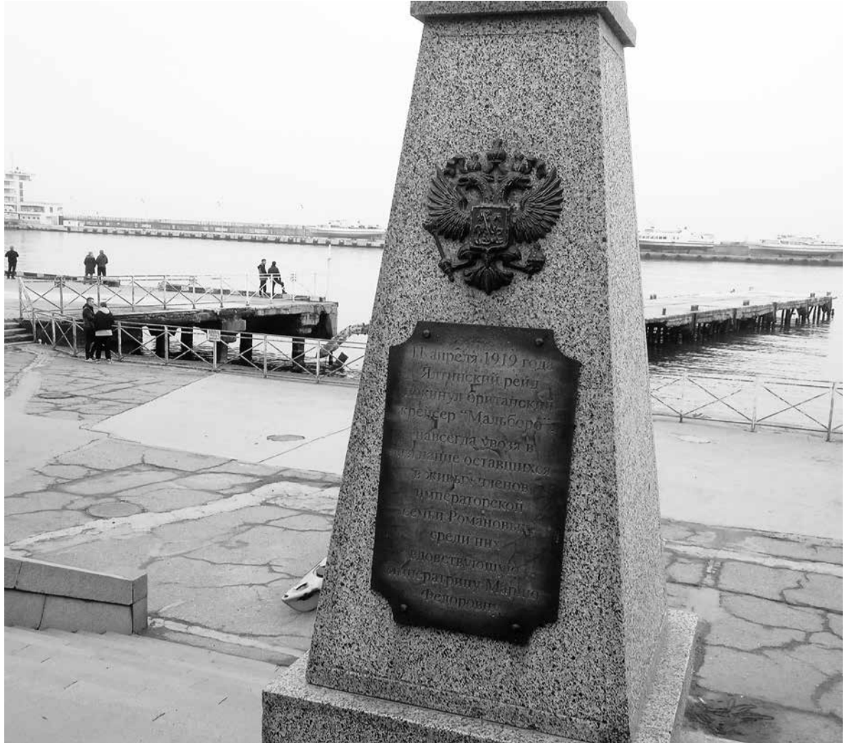
На памятной доске мы написали на русском и английском языках: «11 апреля 1919 года Ялтинский рейд покинул британский крейсер «Мальборо», навсегда увозя в изгнание оставшихся в живых членов императорской семьи Романовых, среди них вдовствующую императрицу Марию Федоровну».