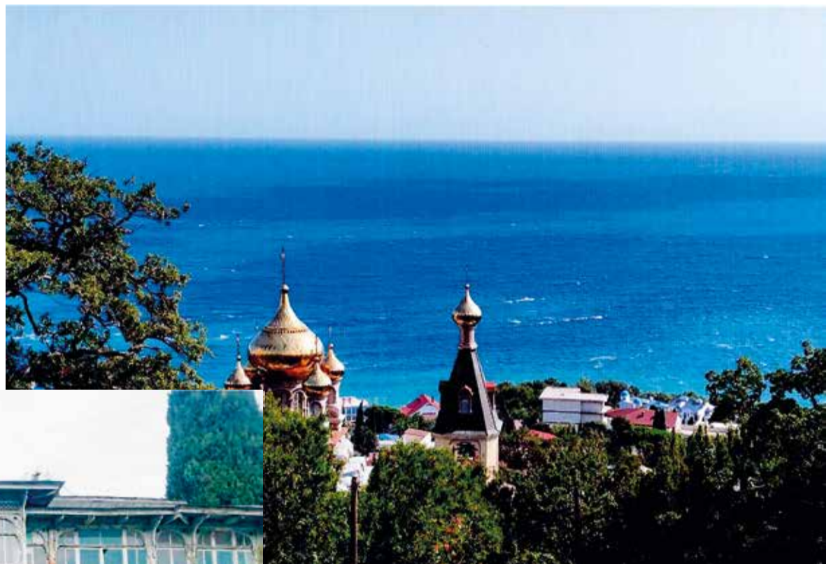
Взгляд на море.