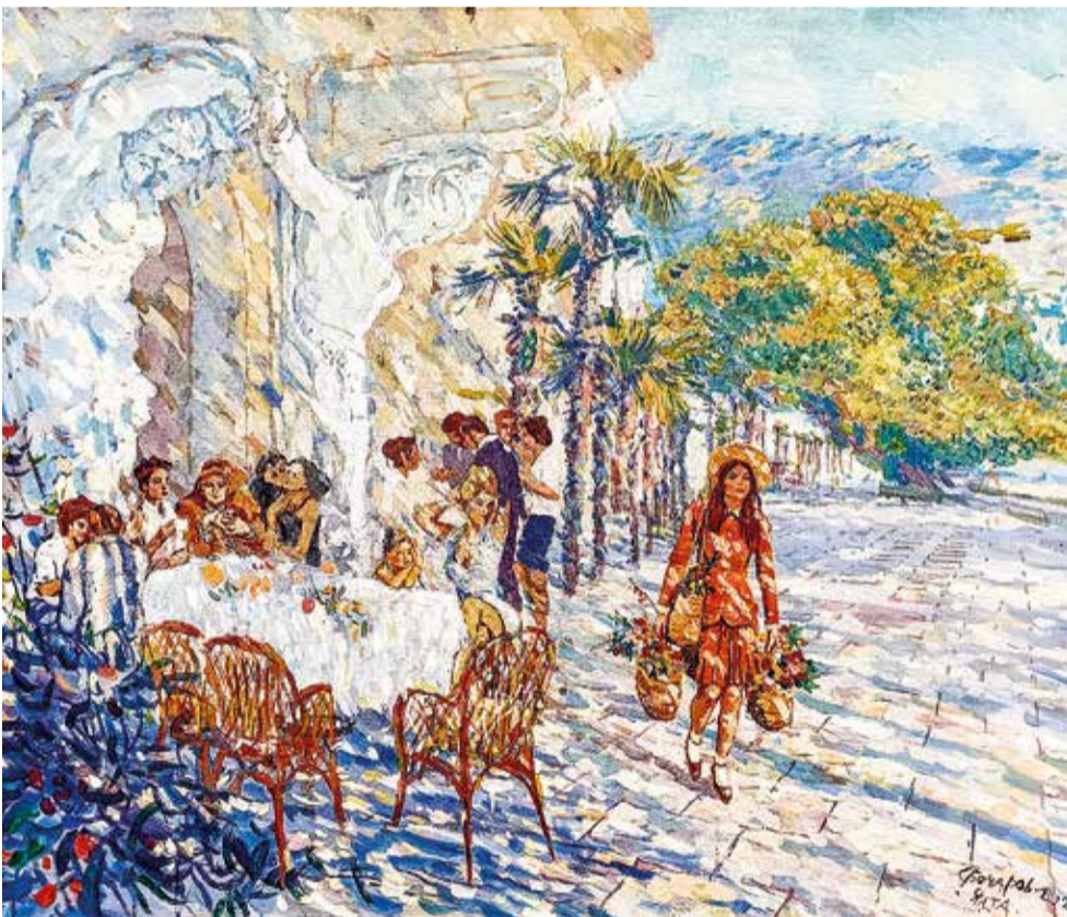
«Атланты Набережной Ялты». 2023. холст, масло. 80x100