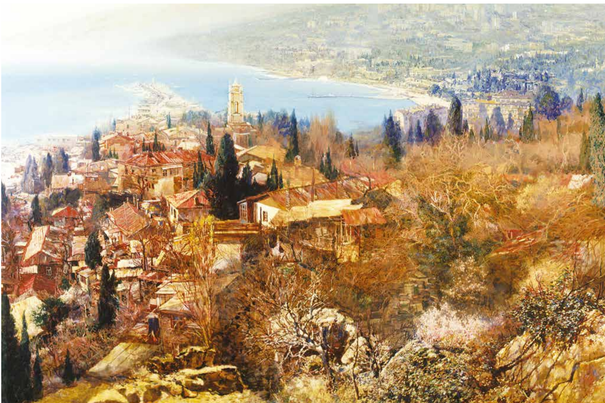
Художник С.П.Бочаров «Вид на Ялту с Поликуровского холма». 1997 г. http://www.botcharov.ru/