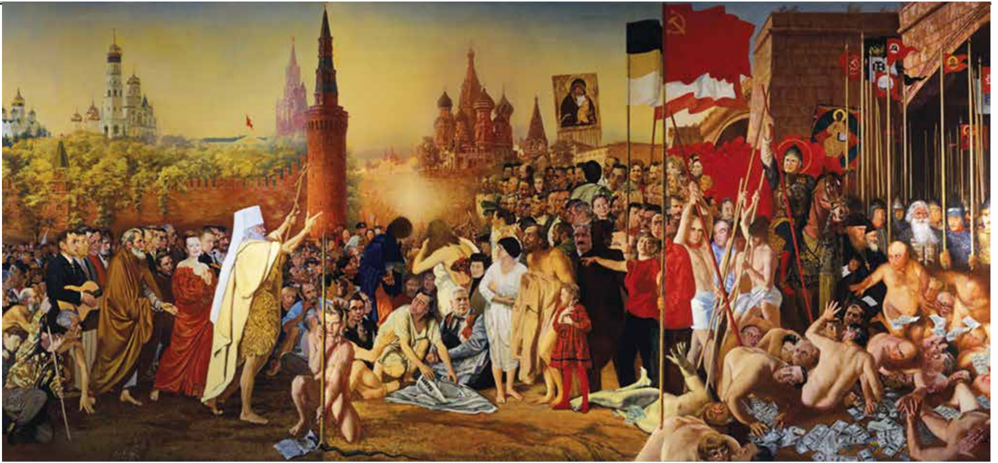
«Явление народа. Русские патриоты, изгоняющие воров и негодяев» 1999–2000 Холст, масло. 300x600