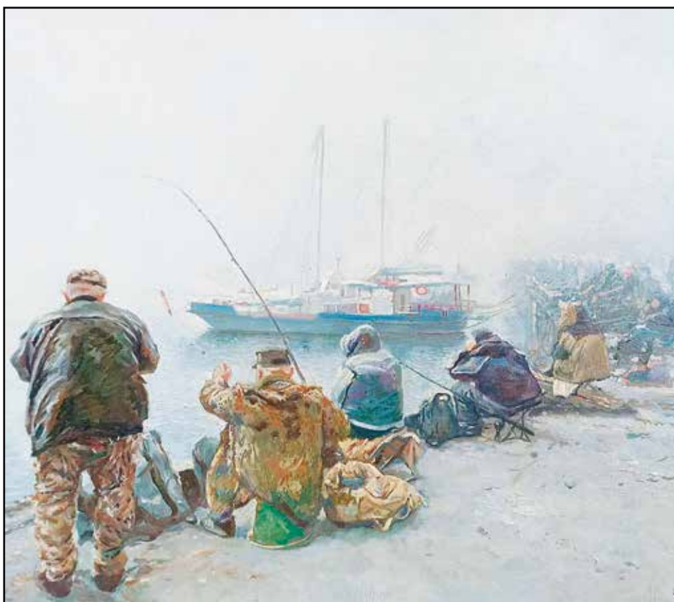
«Ялта. Рыбаки». 2002 Холст, масло. 35x50