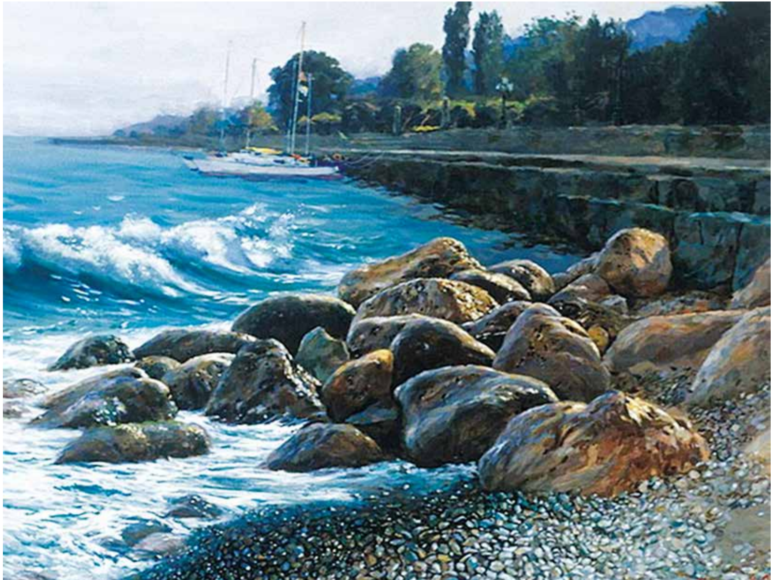
С.П. Бочаров. Ялта. Набережная. Камни у гостиницы «Марино». 1999 г. Холст, масло. 60 x 80 см.

Вся живопись Крыма сейчас – это подражание позднему Корови-