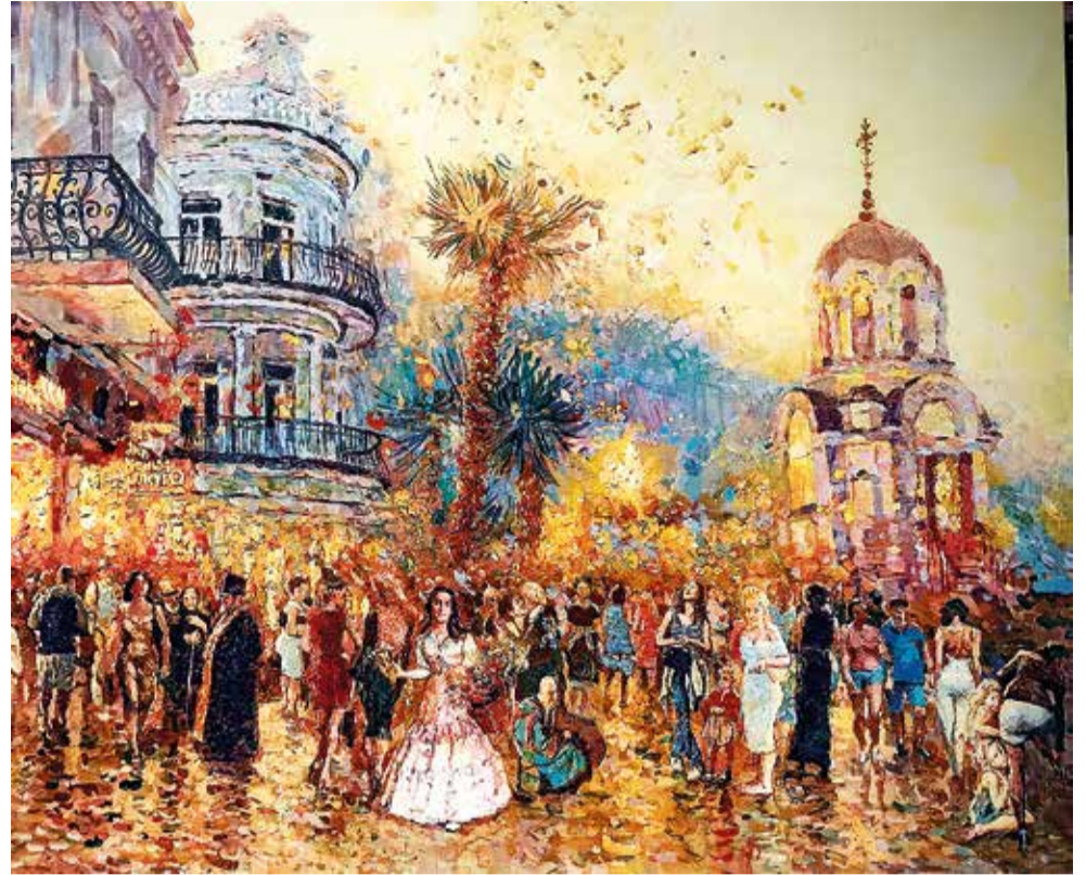
«Цветочница Набережной имени В.И. Ленина в Ялте». 2023. холст, масло 80x100