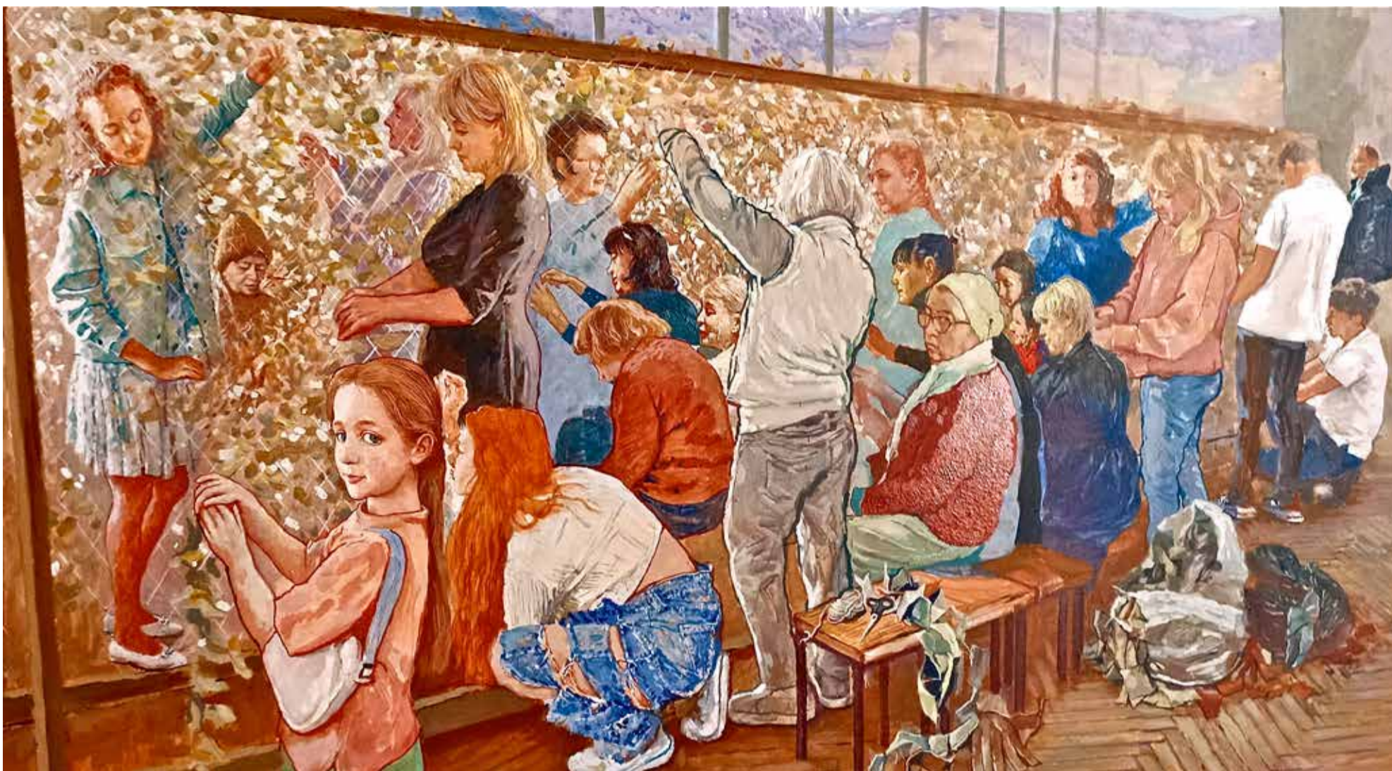
Художник С.П.Бочаров «Всё для фронта, всё для Победы! Ялтинские женщины фонда «Авангард» плетут маскировочные сети для наших героев СВО». 2024 г.