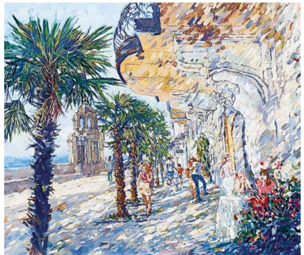
«Вид на Набережную Ялты с часовней». 2023. холст, масло. 80x100