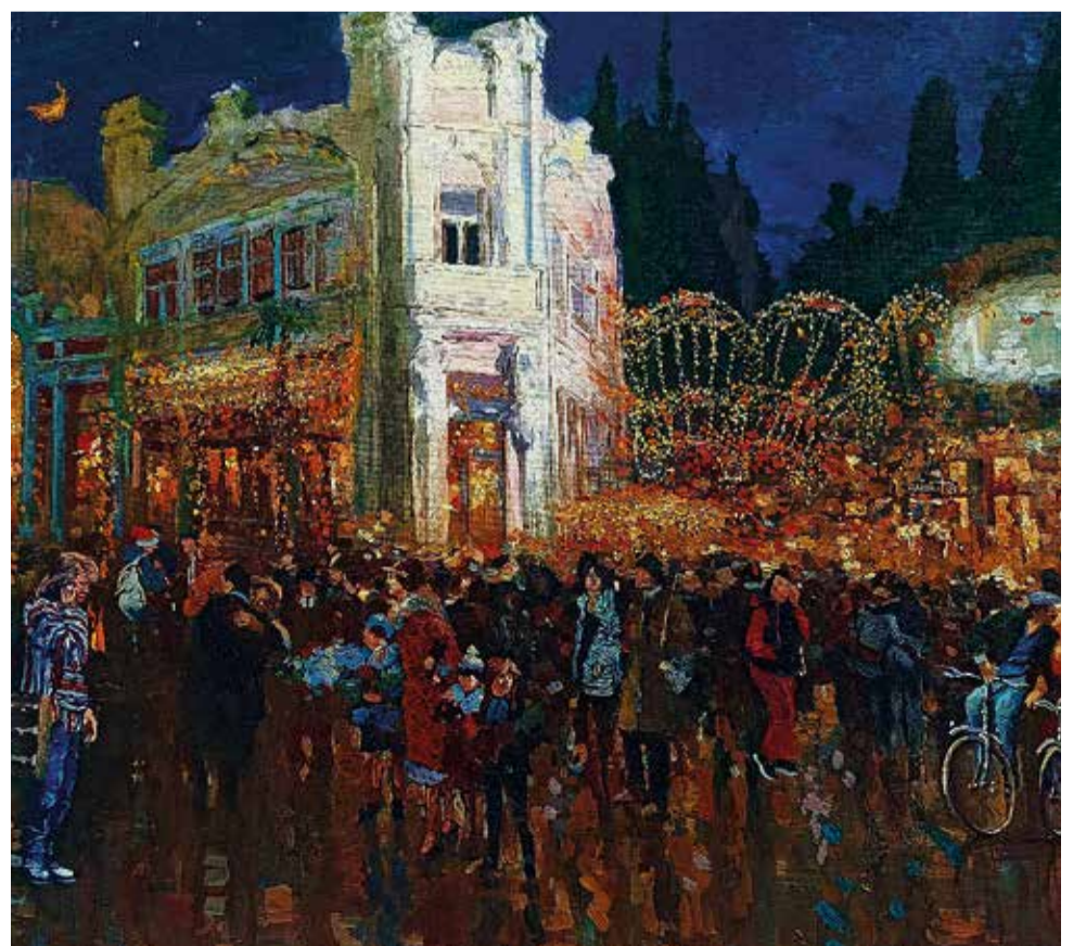
«Новогодняя ночь 2023 года на Набережной у кафе «Чёрное море»». 2023. холст, масло 80x100.