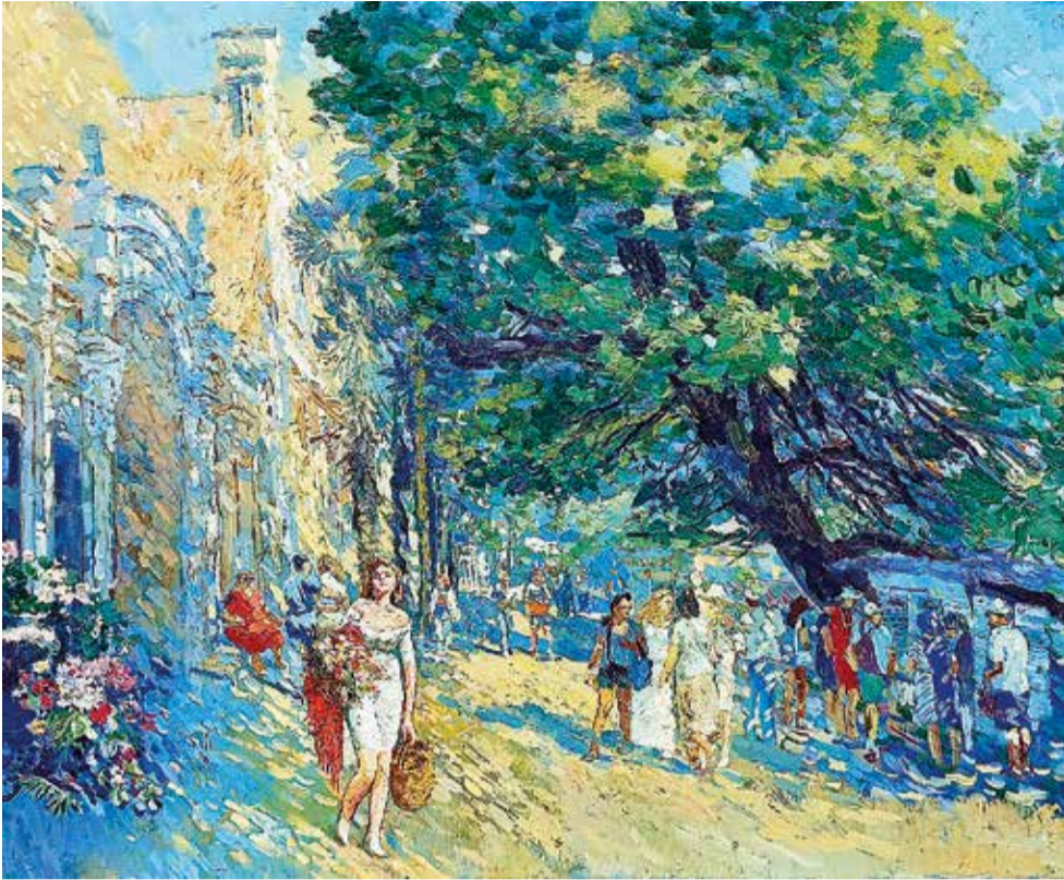
«Набережная с роскошной пинией у «Ялтинского дворика». 2023. холст, масло. 70x90.