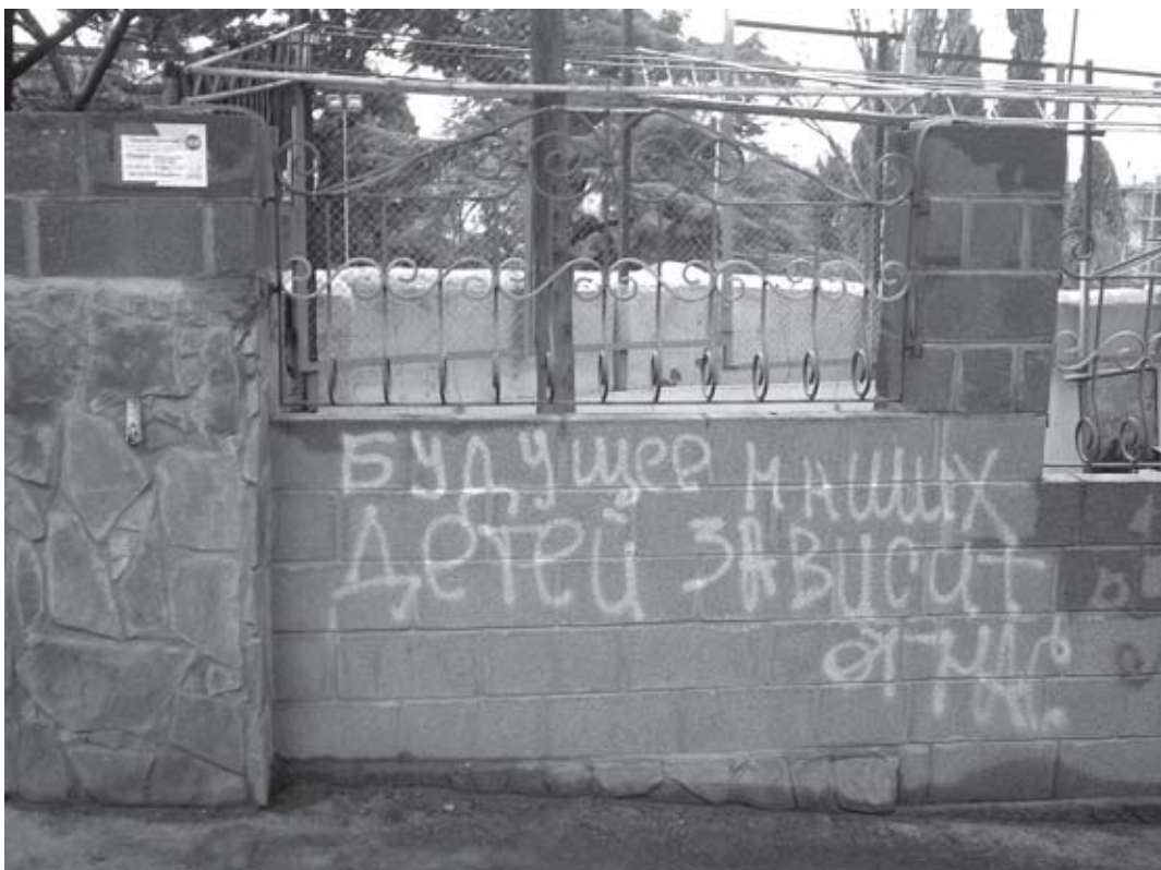
«Социальная реклама» напротив Колоннады