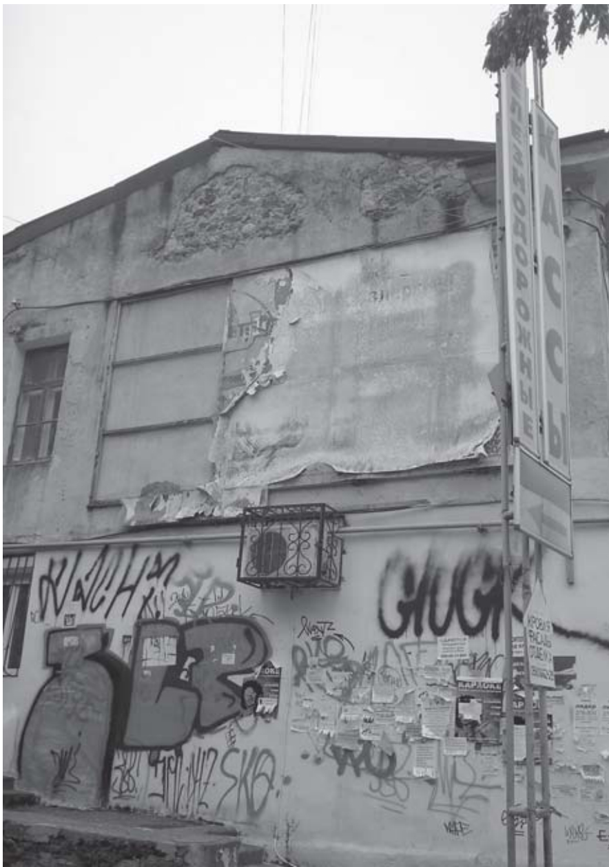
Вот такая стеночка пугает туристов у железнодорожных касс

24 февраля пройдёт заседание Ялтинского горисполкома, посвященное подготовке к курортному сезону. Мы предлагаем отцам города отбросить традиционную риторику о стремлении улучшить обслуживание отдыхающих и вместе с нами прогуляться по Ялте. А критиковать необходимо любую власть. Иначе власть замыкается в самодовольстве и переходит в самообслуживание.