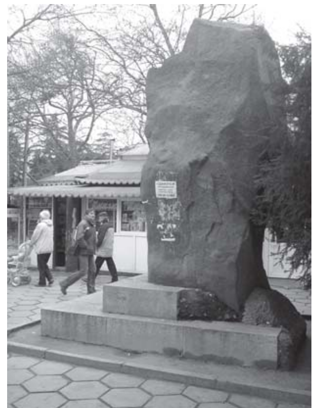
Бесхозная «глыба» в скверике у вещевого рынка