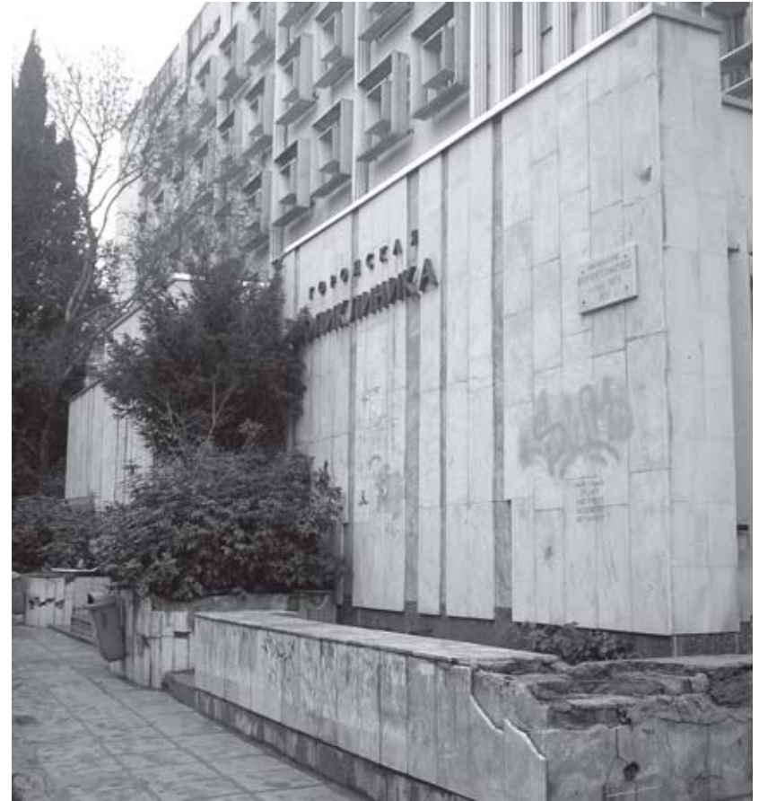
Неприглядный фасад горполиклиники