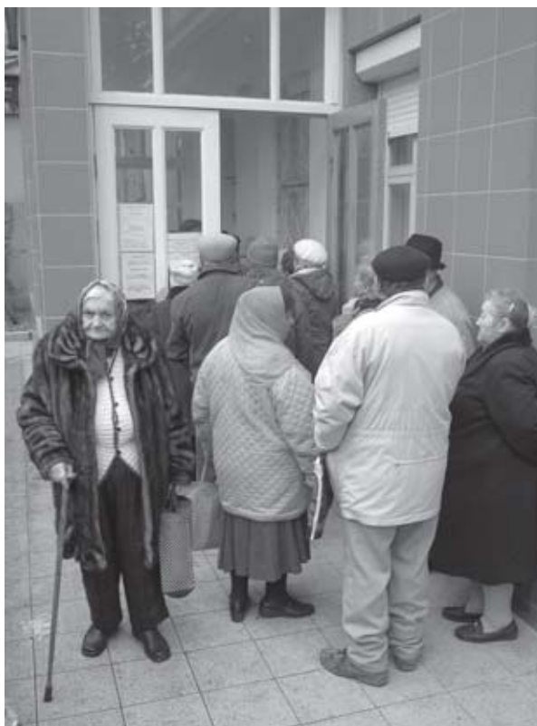
Отдыхающие удивляются толпам пенсионеров у здания суда. Это «дети войны» пытаются получить положенные им надбавки