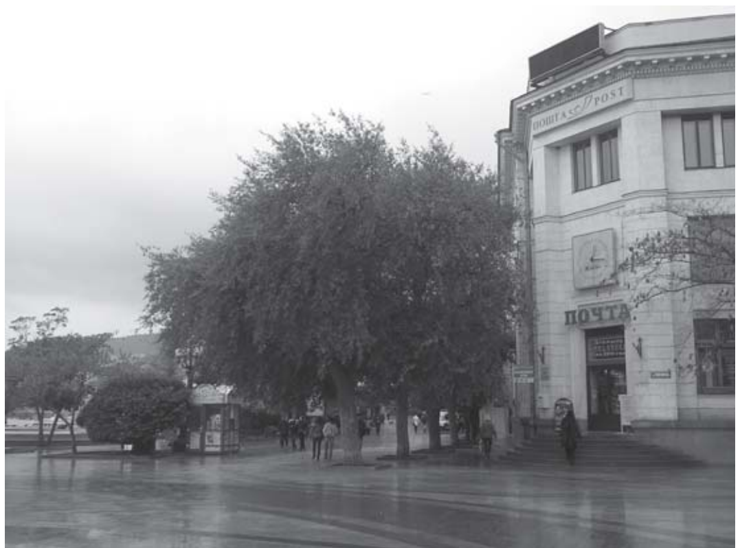
Часы на главпочтамте не ходят уже полгода