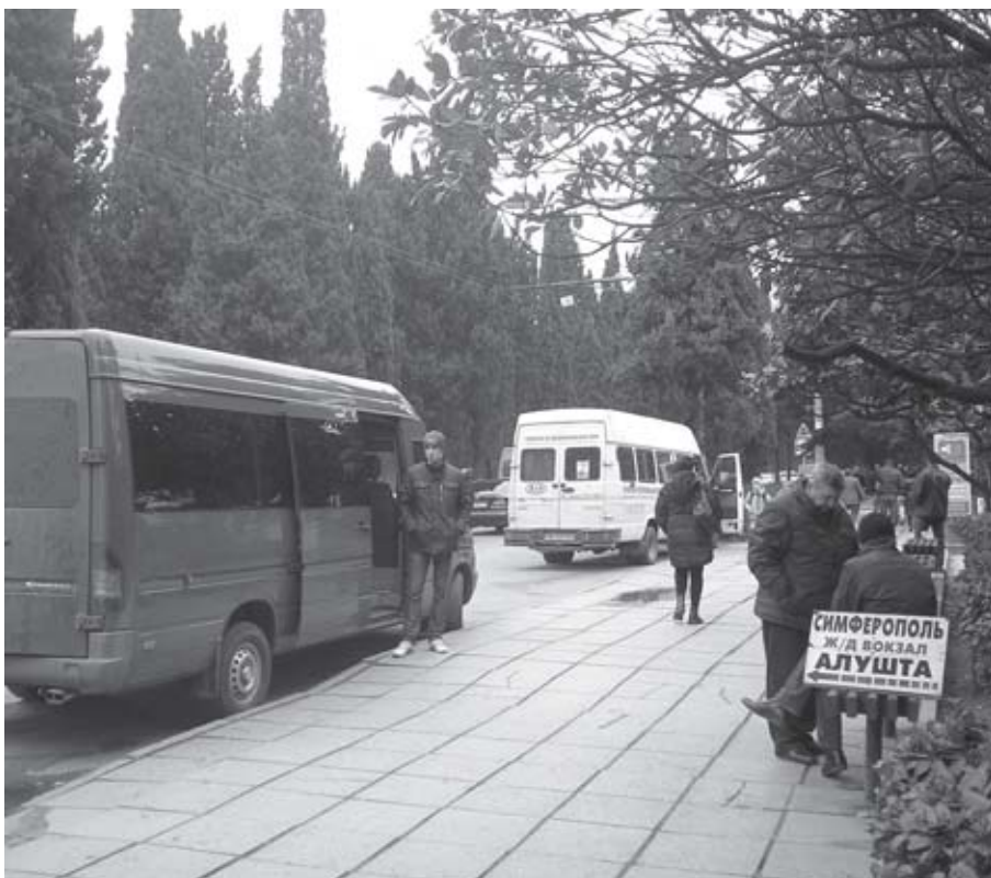
Полулегальная автостанция на... скамейке