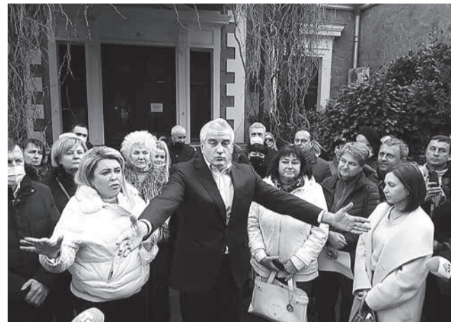
На сегодняшний день Сергей Аксёнов — самая влиятельная фигура в Крыму. Зачастую ему приходится руководить в ручном режиме.

-- Недавно Президент России В.В. Путин поручил Правительству РФ разработать и утвердить перечень объектов культурного наследия народов Российской Федерации, требующих проведения полного комплекса научно-реставрационных работ в первоочередном порядке. Какие, на Ваш взгляд, крымские памятники истории и культуры должны войти в этот список?