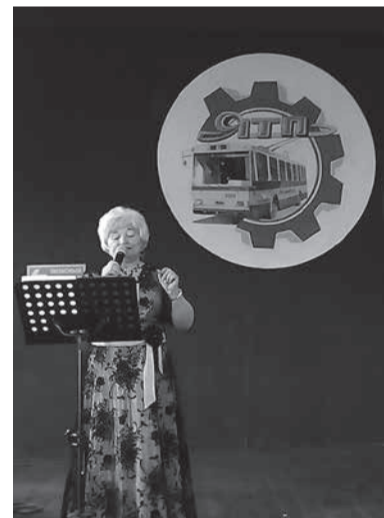
Ялтинский троллейбусный парк отметил 60 лет создания предприятия. Уникальный для сегодняшнего дня плакат висит здесь с советских времён.

Геннадий КУКСОВ, член Таврического клуба психологической антропологии современности